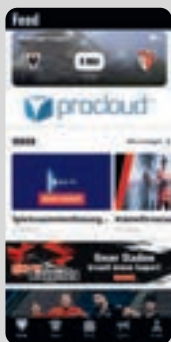
Seit Dezember 2023 informiert der FC Aarau seine Fans auch über eine eigene App.