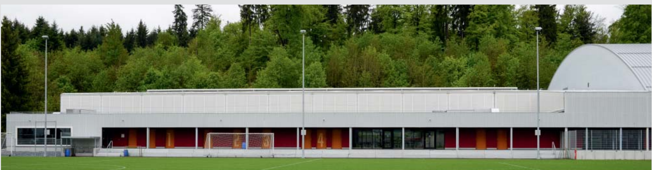
Das neue Garderobengebäude auf dem Trainingsgelände.

Die langen Verfahren, Änderungen von Vorschriften und Gesetzen, neue Auflagen der Swiss Football League sowie ein verändertes Marktumfeld erforderten jedoch seitens der mit dem Stadionbau beauftragten HRS Real Estate AG eine wirtschaftliche und finanzielle Neubeurteilung des Vorhabens. Die in der Öffentlichkeit bekannten 36 Mio. CHF als Kaufpreis des Stadions basierten immer auf einer Querfinanzierung über die geplante Mantelnutzung mit einem Einkaufszentrum. Wegen des boomenden Online-Handels, sinkender Margen und geänderter Expansionspläne der Detailhändler kann diese aktuell am Markt nicht mehr erzielt werden. Aufgrund dieser geänderten Ausgangslage suchen die involvierten Parteien nach Lösungen, wie die fehlende Restfinanzierung anderweitig sichergestellt werden könnte. Damit verzögert sich der Baubeginn des neuen Fussballstadions weiter, und der FC Aarau bleibt in seinen sportlichen und vermarktungsmässigen Möglichkeiten weiterhin eingeschränkt.