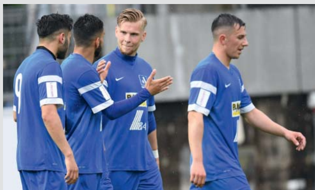
Das Team Aargau U-21 spielt in der 2. Liga interregional.

Die FC Aarau AG bezweckt die Durchführung, Organisation und Leitung eines Profi-Fussballbetriebes mit den dazugehörigen und unterstützenden Aktivitäten. Die Nachwuchsförderung im Leistungs- und Spitzenfussball (U-21, U-18, U-16) ist im Verein Team Aargau integriert; einer Partnerschaft zwischen dem FC Aarau, dem FC Wohlen und dem FC Baden. Die jüngeren Leistungsmannschaften (U-12 bis U-15), die unter dem Begriff Préformation zusammengefasst werden, sind wiederum bei der FC Aarau AG angegliedert. Die Préformation umfasst aktuell 6 Mannschaften mit etwa 100 Spielern und Trainern.